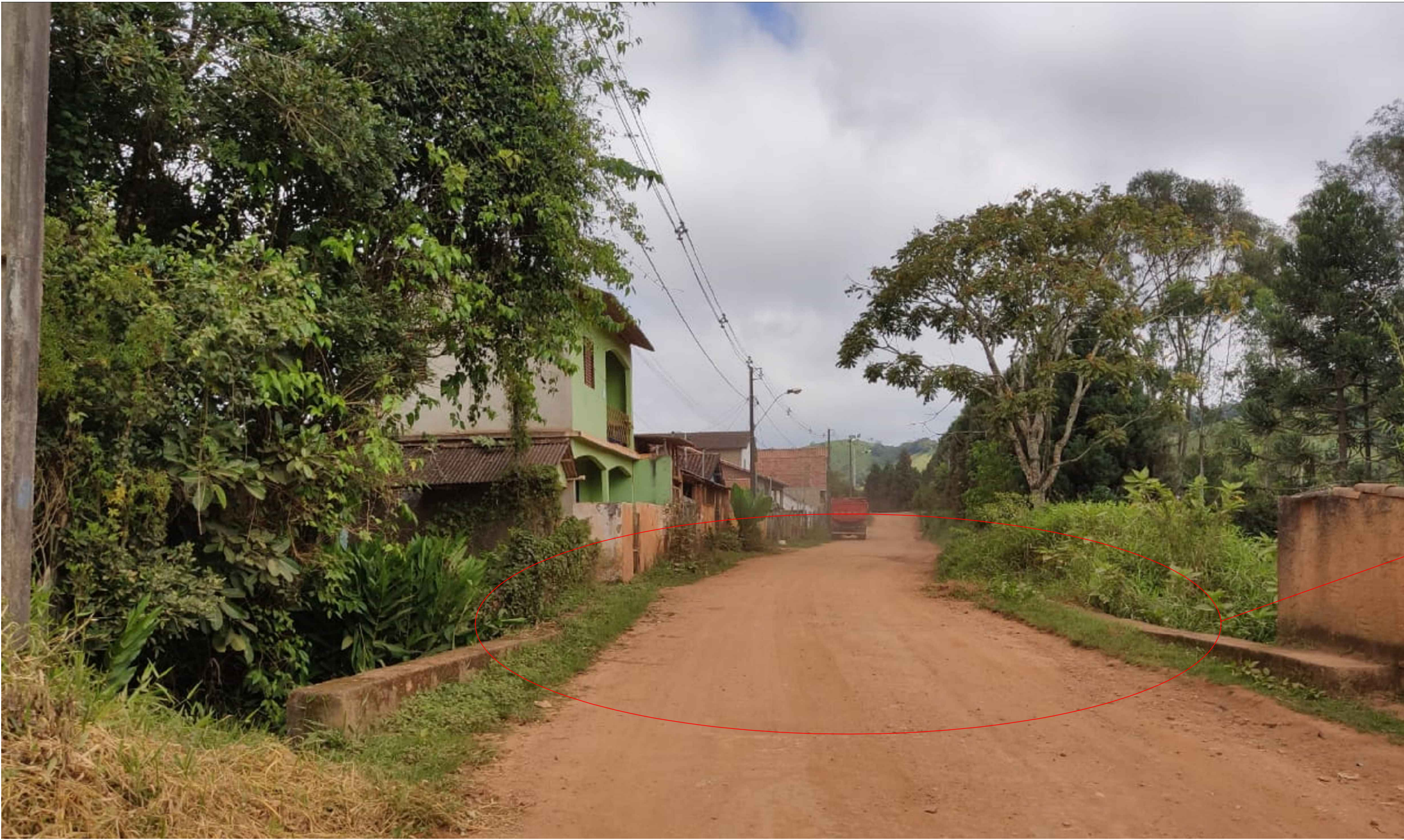
RUA JOAQUIM MACIEL - TRECHO 02 E 03 COMPLEMENTAÇÃO À SITUAÇÃO SEM ESCALA

Término do calçamento do Trecho 03 (poste existente)