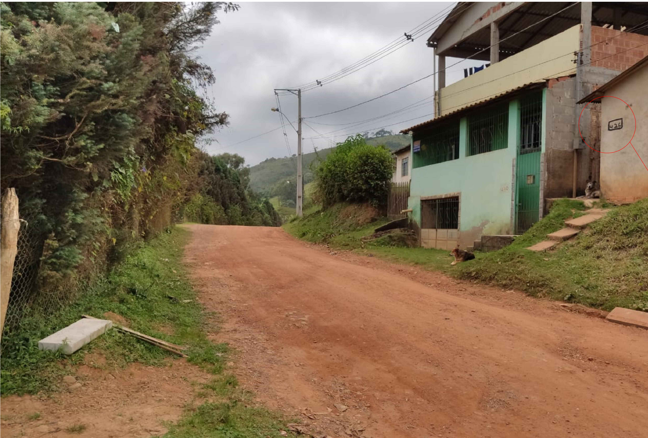
RUA JOAQUIM MACIEL - TRECHO 02 COMPLEMENTAÇÃO À SITUAÇÃO SEM ESCALA