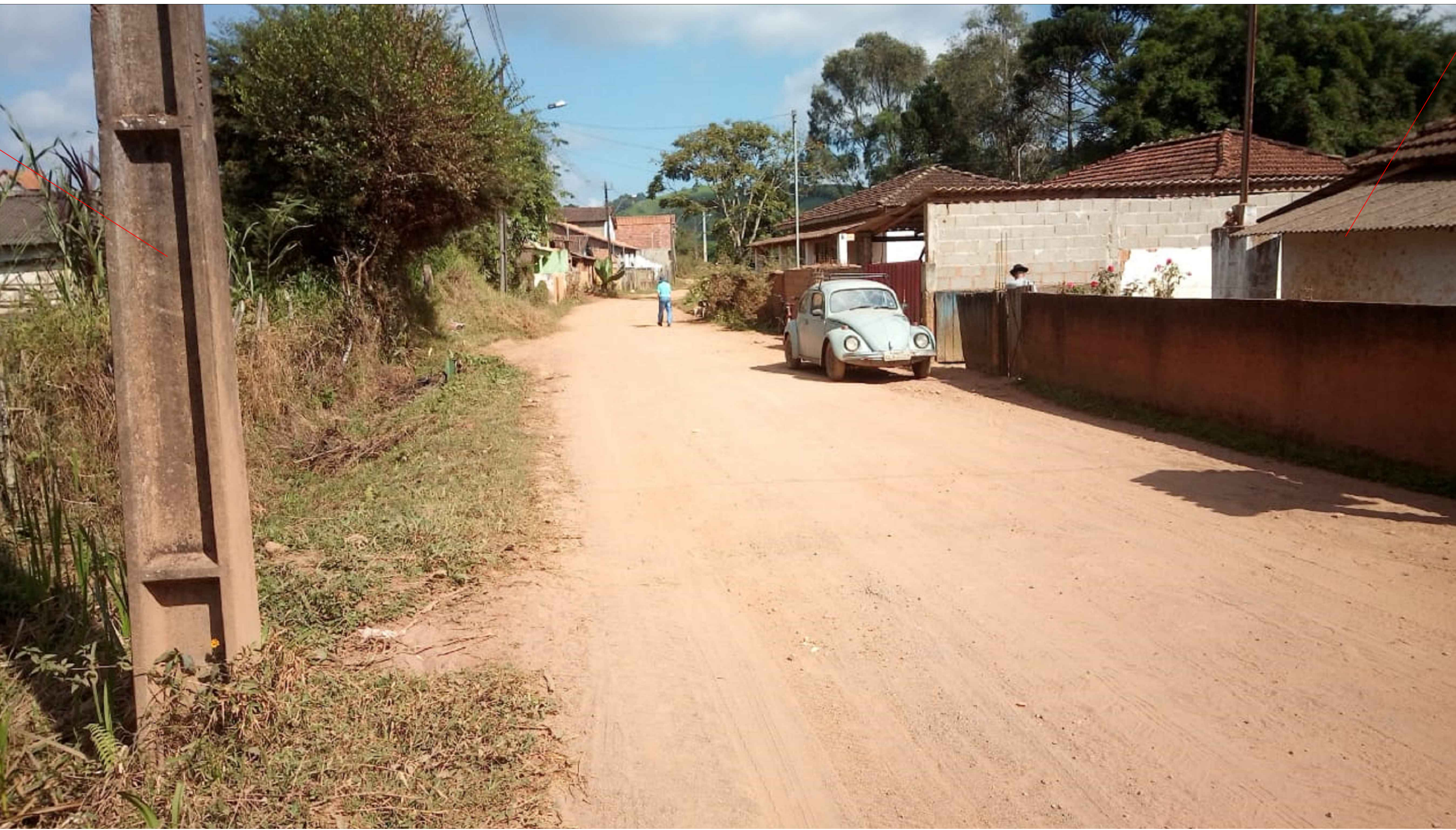
RUA JOAQUIM MACIEL - TRECHO 03 COMPLEMENTAÇÃO À SITUAÇÃO SEM ESCALA

Término do calçamento do Trecho 02 e início do trecho 03